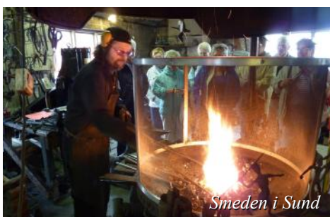
Smeden i Sund