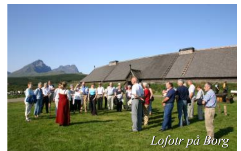
Lofotr på Borg