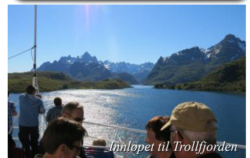
Innløpet til Trollfjorden